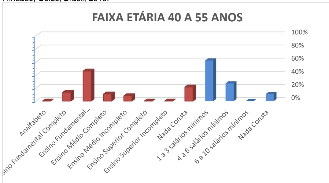
Gráfico 03 - Escolaridade e Renda Familiar dos pacientes estudados que compõem o Grupo C. Trindade, Goiás, Brasil, 2015.

No grupo C, cuja faixa etária é dos 40 aos 55 anos,o gráfico 3 demonstra que 45, 94% não concluíram o Ensino Fundamental, 13,52% possui o Ensino Fundamental completo, 10,82% concluíram o Ensino Médio, 8,1% não concluíram o Ensino Médio. Nesse grupo, não havia indivíduos analfabetos ou que tivessem cursado o Ensino Superior e, não foram encontradas informações sobre o nível de escolaridade em 21,52% dos prontuários dessa faixa etária.