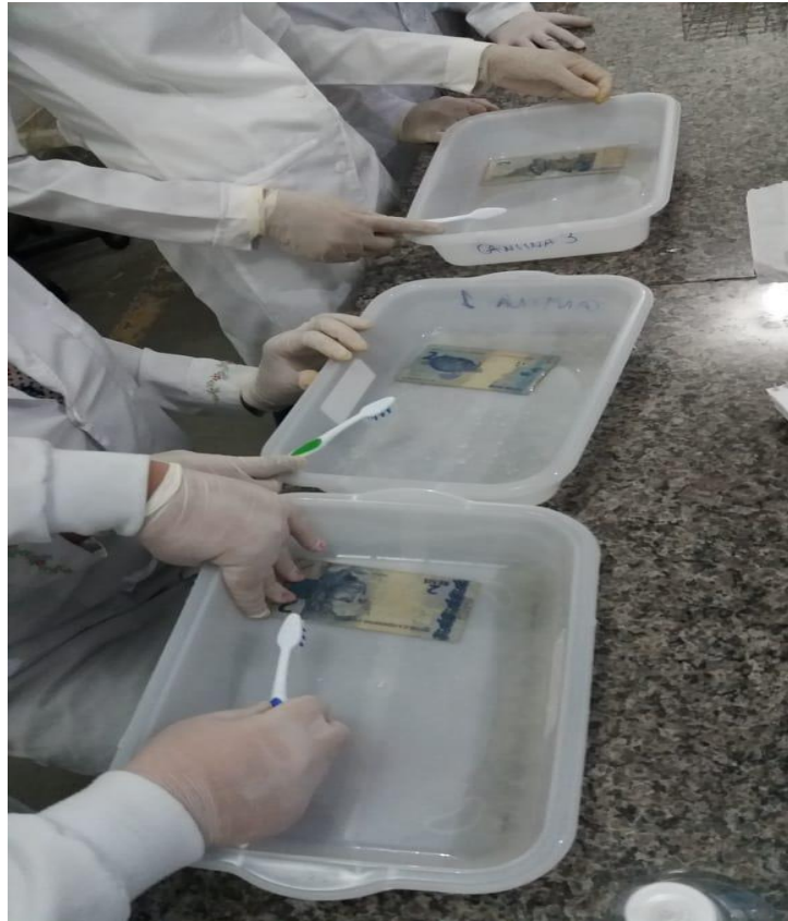
Figura 2 – Processo da lavagem.

Cada nota e moeda foram colocadas numa cuba plástica, mergulhadas em soro fisiológico e feito a escovação sendo utilizada uma escova para cada nota e moeda para não haver contaminação (Figura 2).