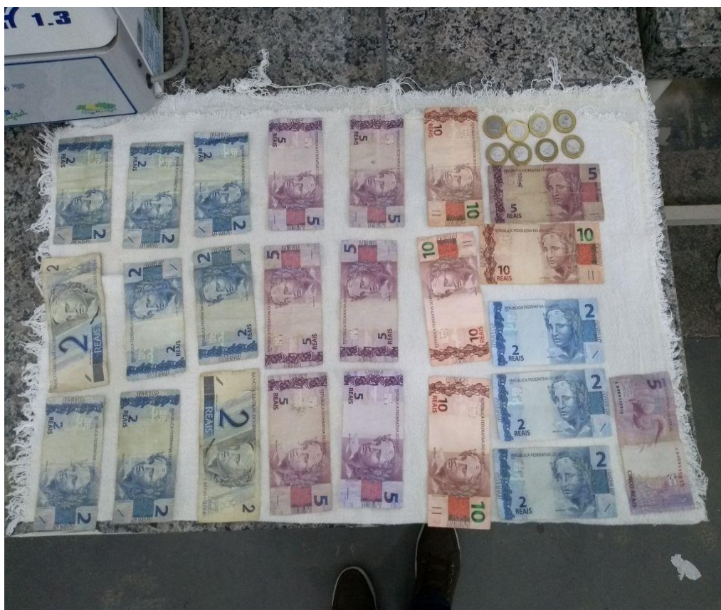
Figura 1 – Cédulas utilizadas para a pesquisa.

Foram coletadas 32 notas incluindo moedas nos valores de R$5,00, R$10,00, R$1,00, R$2,00 (Figura 1).