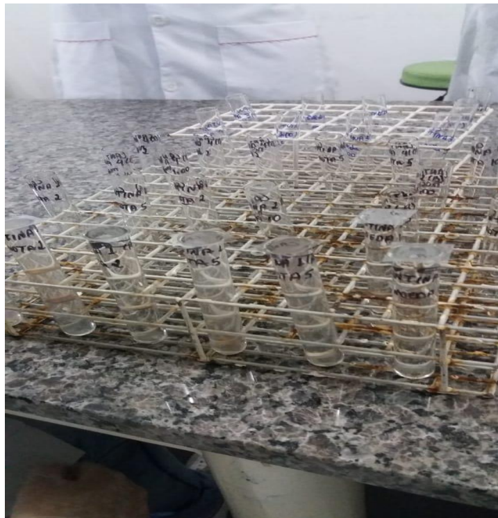
Figura 3 – Método de flutuação

E foi também realizado o método de Hoffman, que é um método de sedimentação e teste qualitativo para a detecção de ovos, e larvas de helmintos, desenvolvido para diagnóstico das enteroparasitoses. Técnica benéfica para ensaios preliminares podendo identificar que grupos de parasitas estão presentes em uma amostra. O principal objetivo da técnica é o aumento da concentração de ovos, larvas cistos, por serem pesados são sedimentados espontaneamente, lavados e concentrados e em seguida examinados (Figura 4).